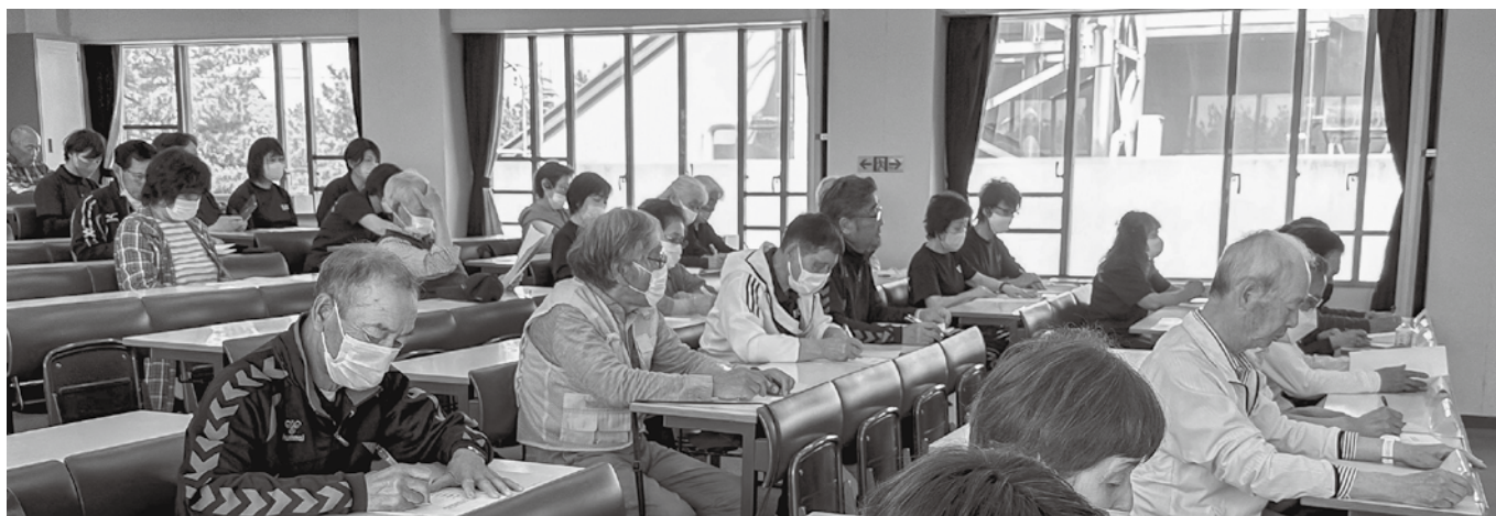
〈昨年のKSC総会の様子〉

※20歳以上の会員の方には4月号広報誌と一緒に総会に関するハガキを同封しておりますのでご確認後、出欠をご記入の上ご返送下さい。